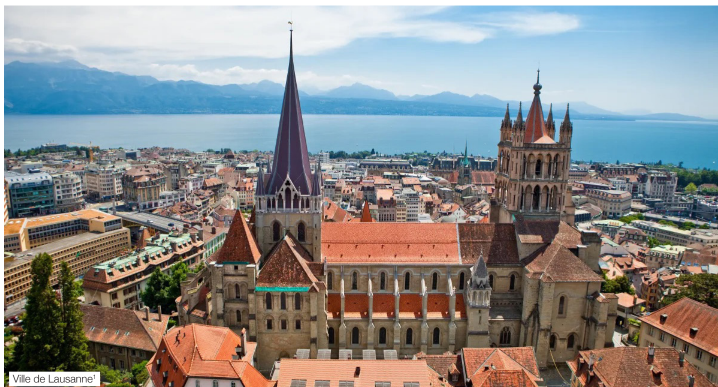
Ville de Lausanne 1

2c. Exercice d'observation : Durant le film, Essaie de reconnaître les lieux de tournage. Trouve le nom d'un pont, d'un quartier et d'une région attenante à Lausanne.