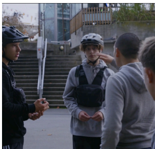
SES AMIS DE LA BIKE LIFE